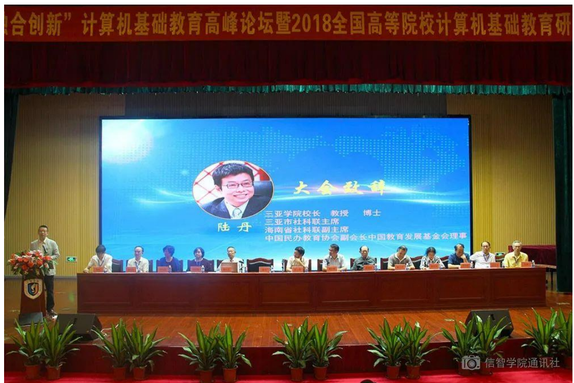
(信息与智能工程学院承办 2018 年全国高等院校计算机基础教育研究会学术年会)