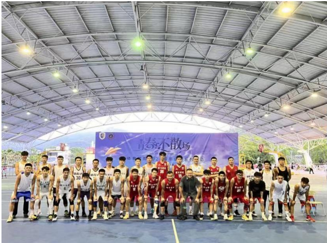
(三亚学院风雨运动场)

学校位于海南省三亚市，毗邻落笔洞文化遗址，美丽校园、宜学宜居，学校图书馆——书山馆被评为海南十大生态建筑。校园占地面积 3000 亩，建筑总面积近 50 万平方米。学校下设 25 个学院，开设 56 个本科专业（含专业方向），涵盖经济学、管理学、法学、文学、教育学、艺术学、工学、理学、医学等 9 个学科门类，在校本科生 24000 余人。