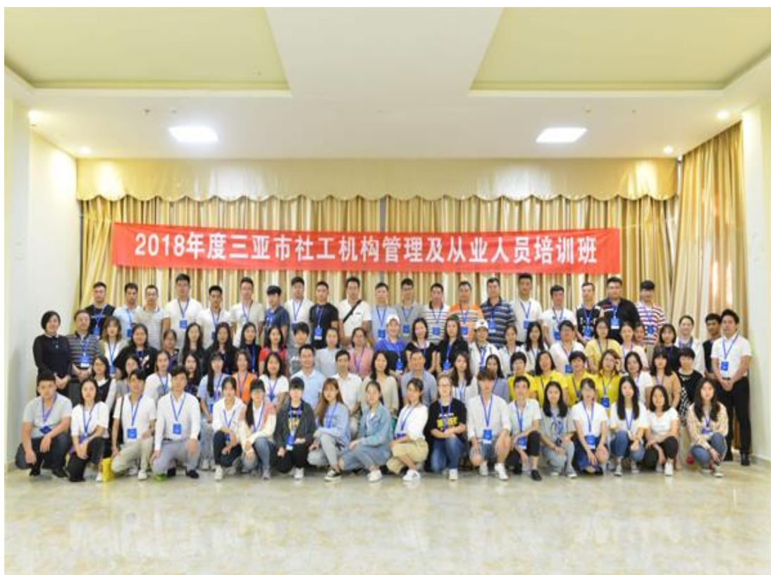
(2018年度三亚市社工机构管理及从业人员培训班合影)