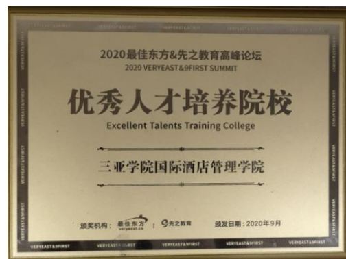
（三亚学院海南旅游消费研究院揭牌仪式） （三亚学院荣获 2020 年优秀人才培养院校）

国际酒店与邮轮运营管理方向服务酒店及邮轮相关产业人才需求，与国际知名酒店和邮轮游艇企业保持高密度、多领域合作。目前已与三亚亚特兰蒂斯酒店签署战略合作协议，在人才培养、师资培训等方面密切合作。在海南自由贸易港建设总体方案的指导下，依托三亚游轮游艇发展的资源禀赋，该方向积极开展游轮游艇产业高质量发展、邮轮游艇新业态旅游项目开发和管理、邮轮游艇产品供给、游轮游艇消费特征等领域的研究，在邮轮经济全产业链发展背景下，培养邮轮游艇旅游项目创新和管理、邮轮游艇航线开发高层次“产业管理型”人才。