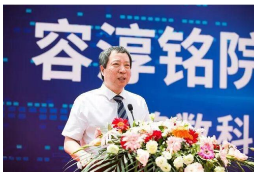
(容淳铭院士工作站)

工学部以海南自贸港高新技术产业、现代服务业等产业布局发展为导向，聚焦人工智能、大数据、智能制造、高性能计算、区块链等科技前沿，依托陈国良院士团队创新中心、容淳铭院士工作站、软件基因工程中心等科研平台，助力智慧海南建设。近年来，主持国家自然科学基金、国家重点研发计划、海南省重点研发计划、海南省自然科学基金等国家级、省部级课题 30 余项。工业互联网实验室是三亚学院与工信部工业信息安全发展研究中心联合研制并建设的新一代工业互联网实验室，是工业互联网工程、智能制造 4.0、工业信息安全、智慧工厂、智慧物流、3D 打印、数字孪生、工业仿真等领域的科研、实验平台。高性能计算（超算）中心是首个民办高校自筹建设的高性能计算中心，是人才培养、科学研究、学科发展、产业协同以及社会服务的重要平台，集群峰值计算能力达 4500 万亿次/秒（双精度浮点），高性能 GPU 集群峰值计算能力达 8120 TFLOPS（单精度浮点）。