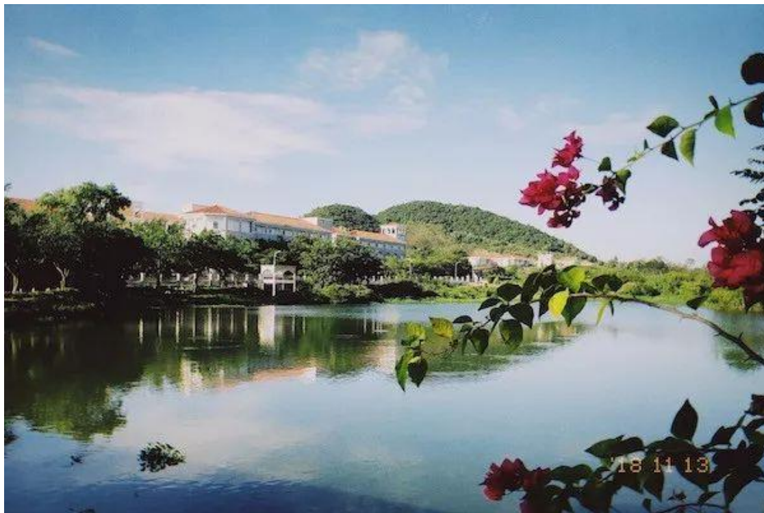
（校园风光-白鹭溪畔）