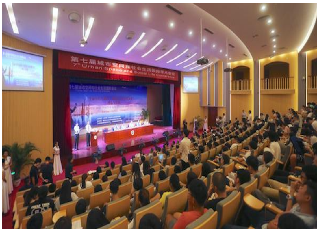
(社会学院联合主办第七届城市空间和社会生活国际会议)