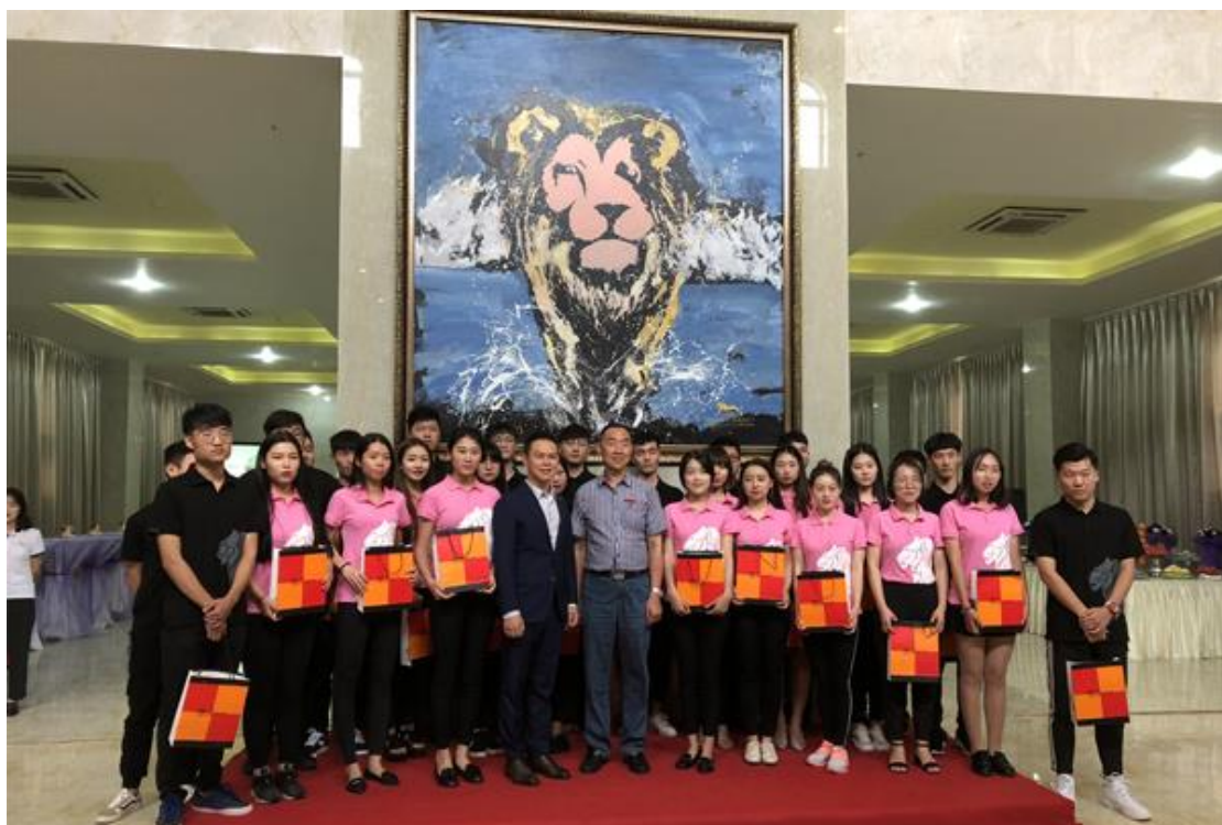
(旅业管理学院与美高梅度假酒店开展订单式人才班选拔活动)