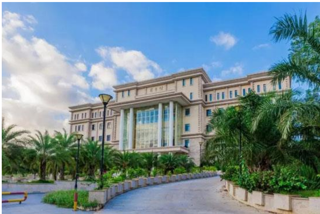
(三亚学院图书馆——海南十大生态建筑之一)